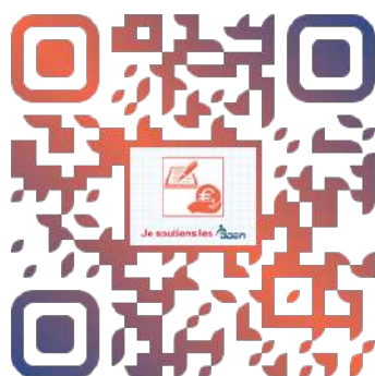
Je soutiens les DDEN

Un numéro d'urgence (0 805 382 300) pour les parents en détresse existe mais n'est pas suffisamment connu, estime la Commission. Celle-ci « recommande de pérenniser ce numéro vert et de renforcer ses missions