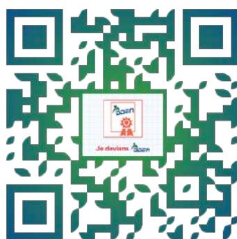
Je deviens DDEN